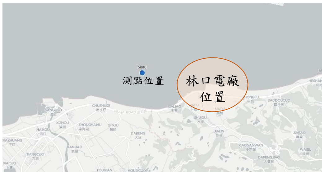
圖 1 監測期間周邊海象監測結果